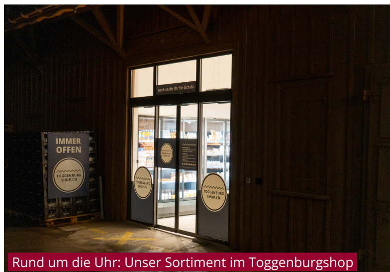
Rund um die Uhr: Unser Sortiment im Toggenburgshop