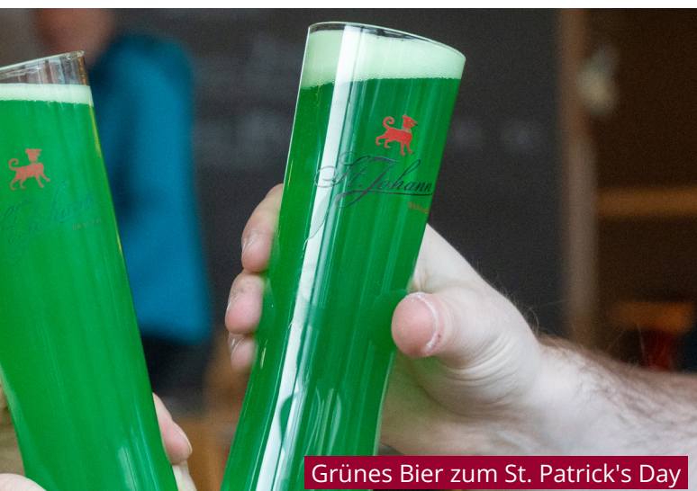
Grünes Bier zum St. Patrick's Day

Mit dem Einzug der Toggenburg Distillery vergangenen März in die Räumlichkeiten der